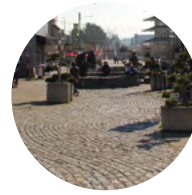
C Cobblestone River