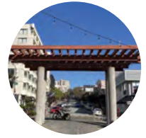
D Torii Gateway Structure