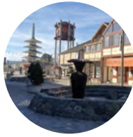
B Origami Fountain - North