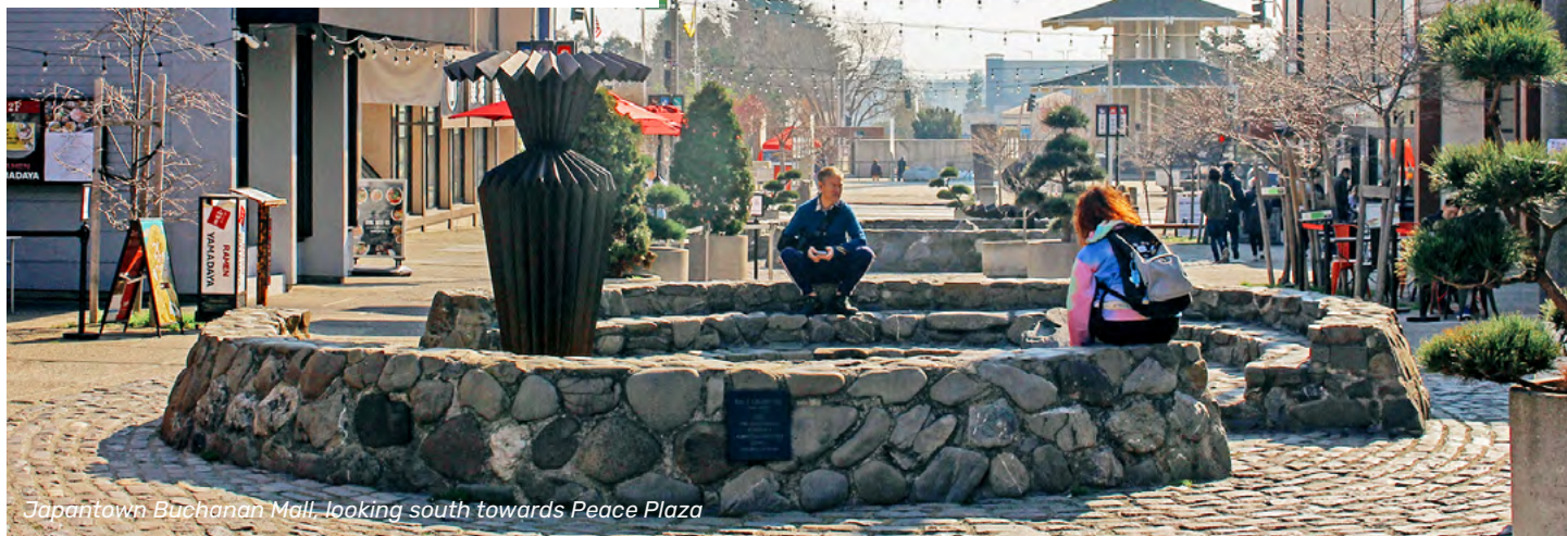
Japantown Buchanan Mall, looking south towards Peace Plaza

Ang Buchanan Mall ng Japantown ay ang malalaking bahagi ng Buchanan Street na isang block ang laki sa pagitan ng Post Street at Sutter Street. Sa hanay ng Peace Plaza, ito ang sentro ng heograpiya at kultura ng komunidad. Ang Mall ay nilatagan ng mga cobblestone, na nag-uugnay sa dalawang inilagay na fountain (bukal) na naglalaman ng mga anyong bulaklak na origami na idinisenyo ng kilalang agad ng sining na si Rush Asawa, at napapaligiran ng mababa at