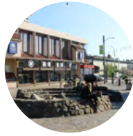
A Origami Fountain - South