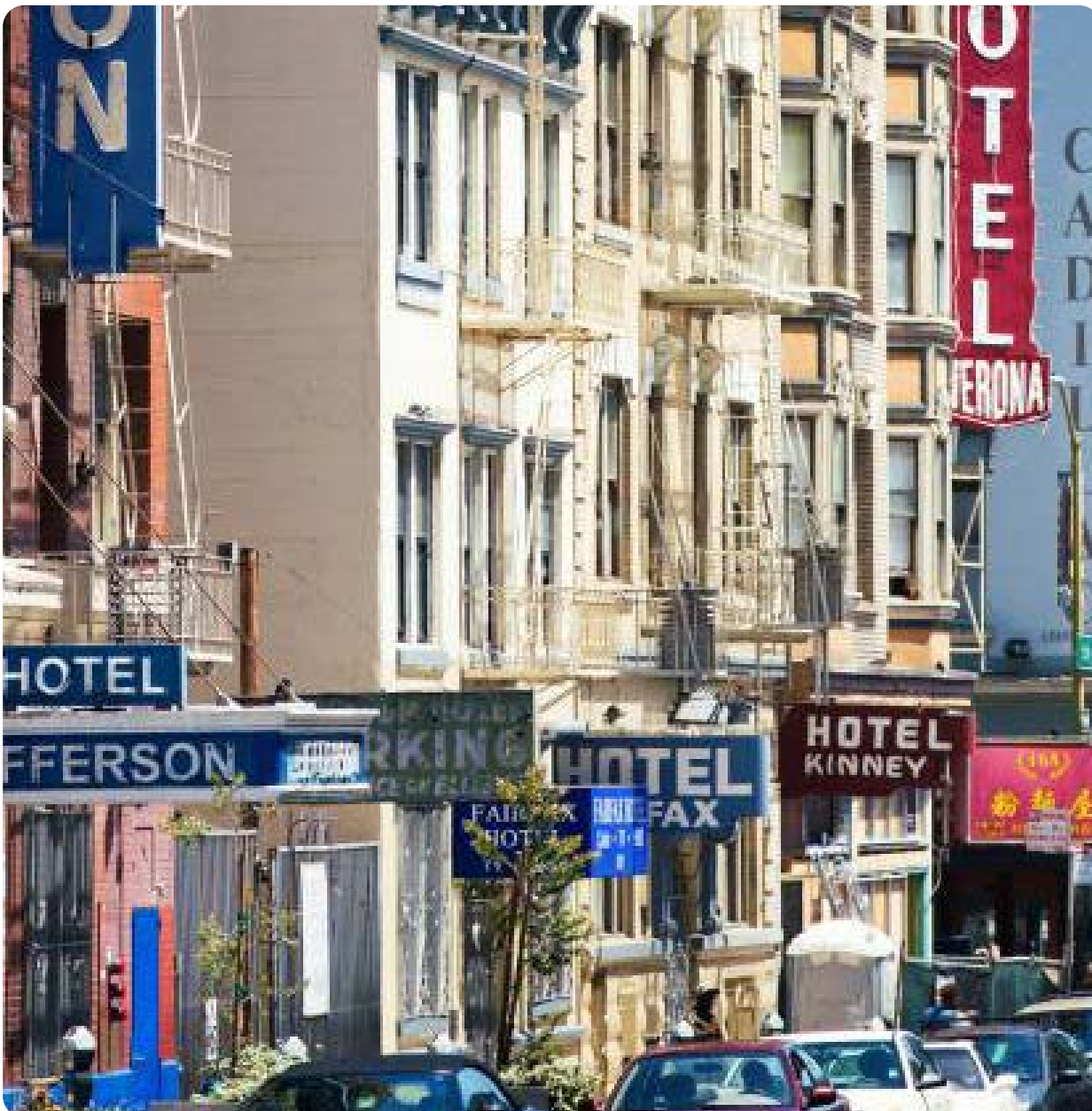
Eddy Street SRO's

Como resultado, abogaremos por más fondos para las SRO y actualizaremos las políticas para garantizar que todos los residentes vivan en condiciones de vivienda dignas.