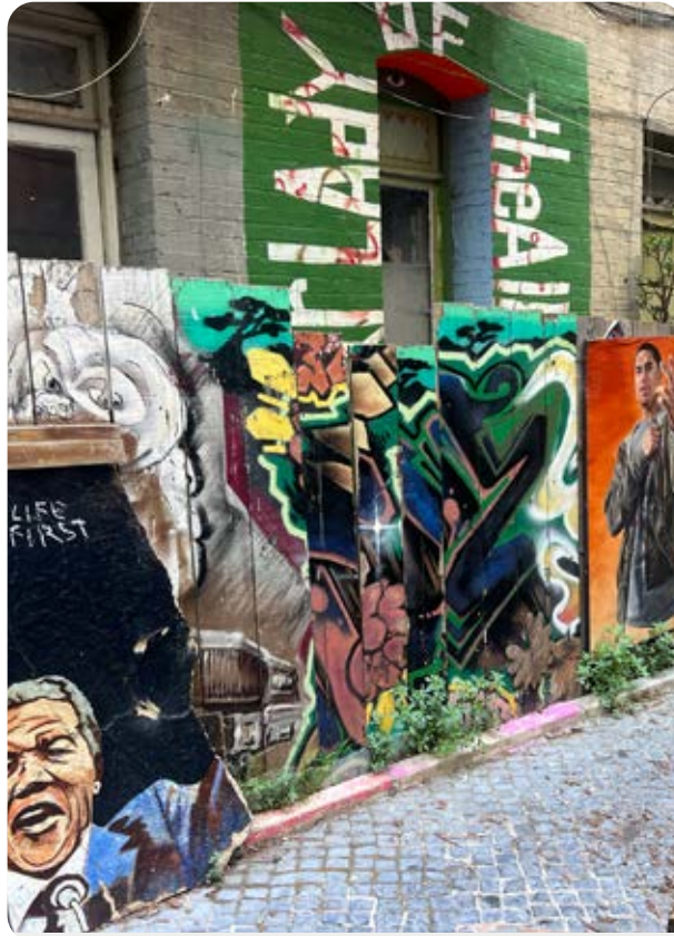
Murales en el Bosque Nacional de Tenderloin