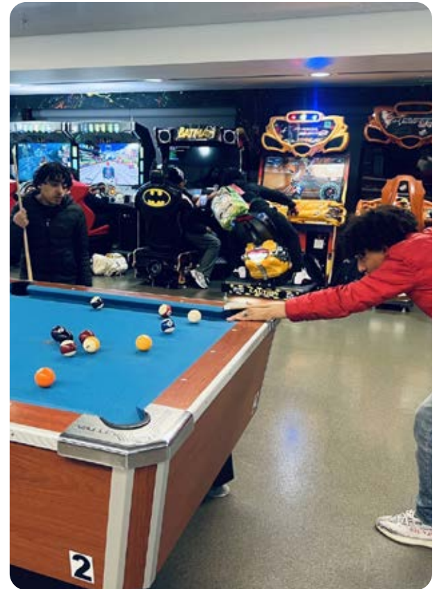
Teen Drop-In Center Hard Launch Event

"Quiero venir aquí todos los días porque este lugar es como un hogar para mí. Hay tantas actividades para elegir. Acabo de volver del arcade y ahora me voy a jugar baloncesto", joven participante.