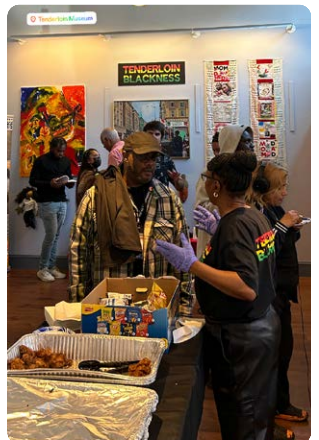
Recepción de inauguración de la exposición TL Blackness

Esta cautivadora muestra no solo rinde homenaje al papel significativo que la comunidad negra ha desempeñado en la conformación de Tenderloin, sino que también pone de relieve la profundidad de las experiencias vividas y las contribuciones sociales de sus miembros. En la recepción de la inauguración hubo un conmovedor panel de discusión, en el que se narraron las historias personales de figuras prominentes de la comunidad negra de Tenderloin, profundizando de este modo la vinculación entre el pasado y el presente de esta vital comunidad. Más de 100 personas asistieron a la recepción inaugural y más de 500 han visitado la exposición desde el mes de agosto.