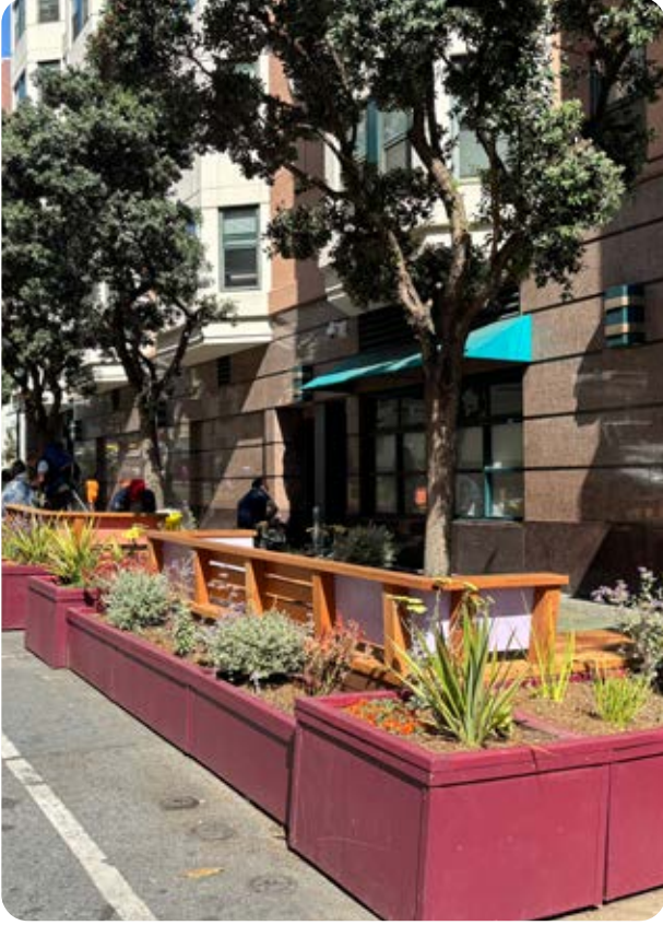
New parklet at 111 Jones