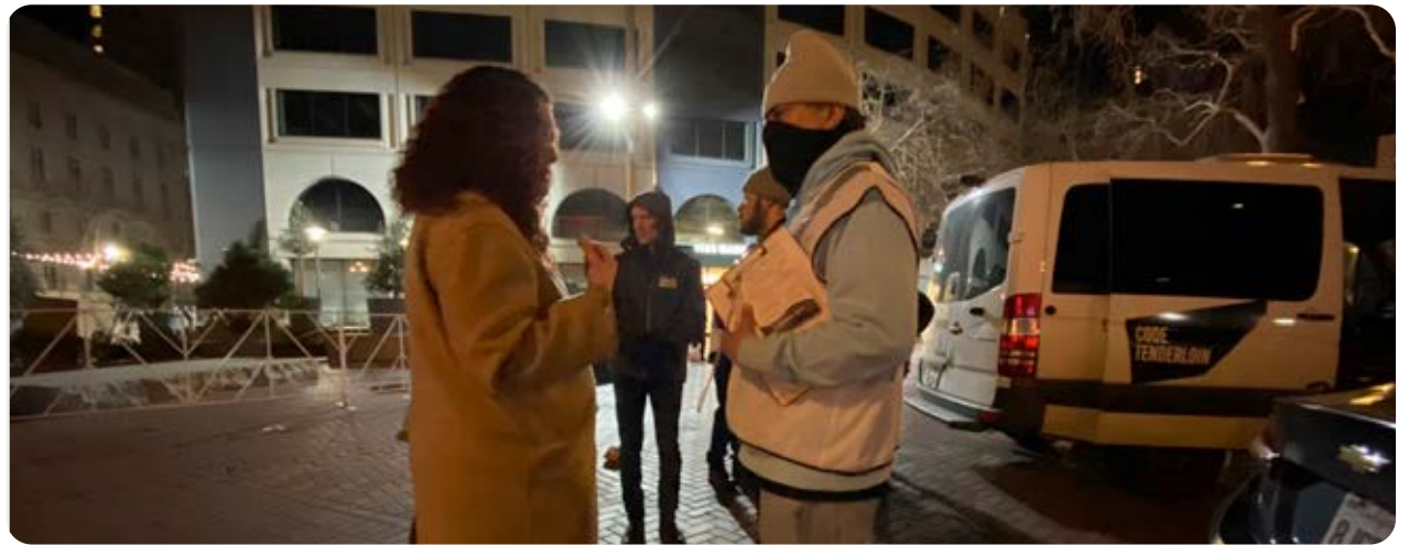
Code Tenderloin's Night Navigators

Se realizaron importantes consultas a pequeños empresarios en Tenderloin y a los interesados de la comunidad para elaborar el programa, y la ciudad llevó a cabo una campaña de información para los establecimientos minoristas para explicarles las nuevas restricciones y limitaciones de horarios antes de que su entrada en vigor. El objetivo de este esfuerzo fue aumentar la seguridad nocturna en Tenderloin, que tiene niveles desproporcionadamente altos de actividades y delitos relacionados con las drogas, especialmente durante la noche. Según el SFPD, al estar abiertos tan tarde, los establecimientos minoristas de alimentos y tabaco pueden (1) facilitar involuntariamente el mercado de drogas nocturno al proporcionar un punto de reunión con iluminación para usuarios y traficantes de drogas, (2) permitir que los usuarios y traficantes se resguarden en su interior para evitar patrullas policiales, y (3) en algunos casos, vender tabaco, parafernalia de tabaco y otros bienes minoristas utilizados por las personas que consumen y venden drogas.