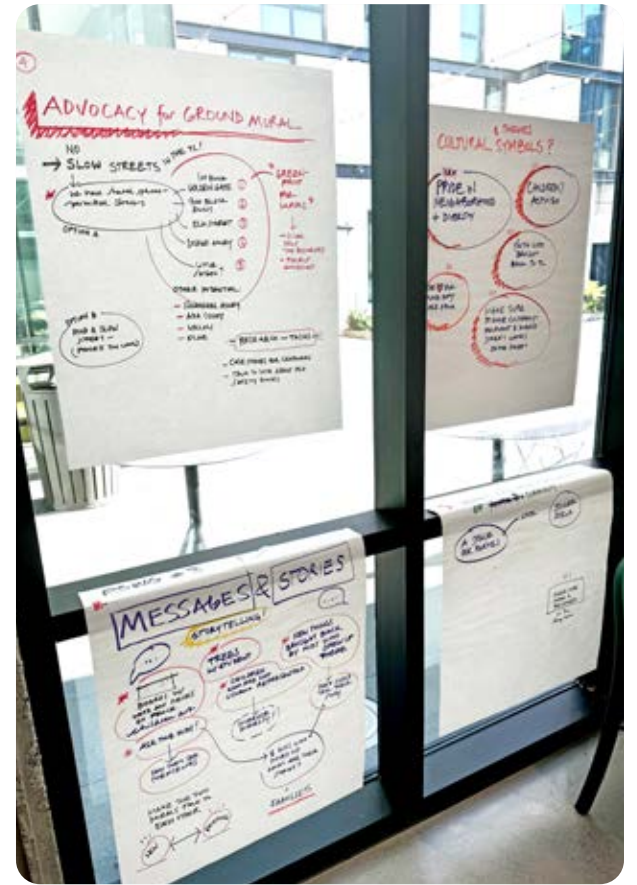
Mesa redonda sobre murales y proyectos