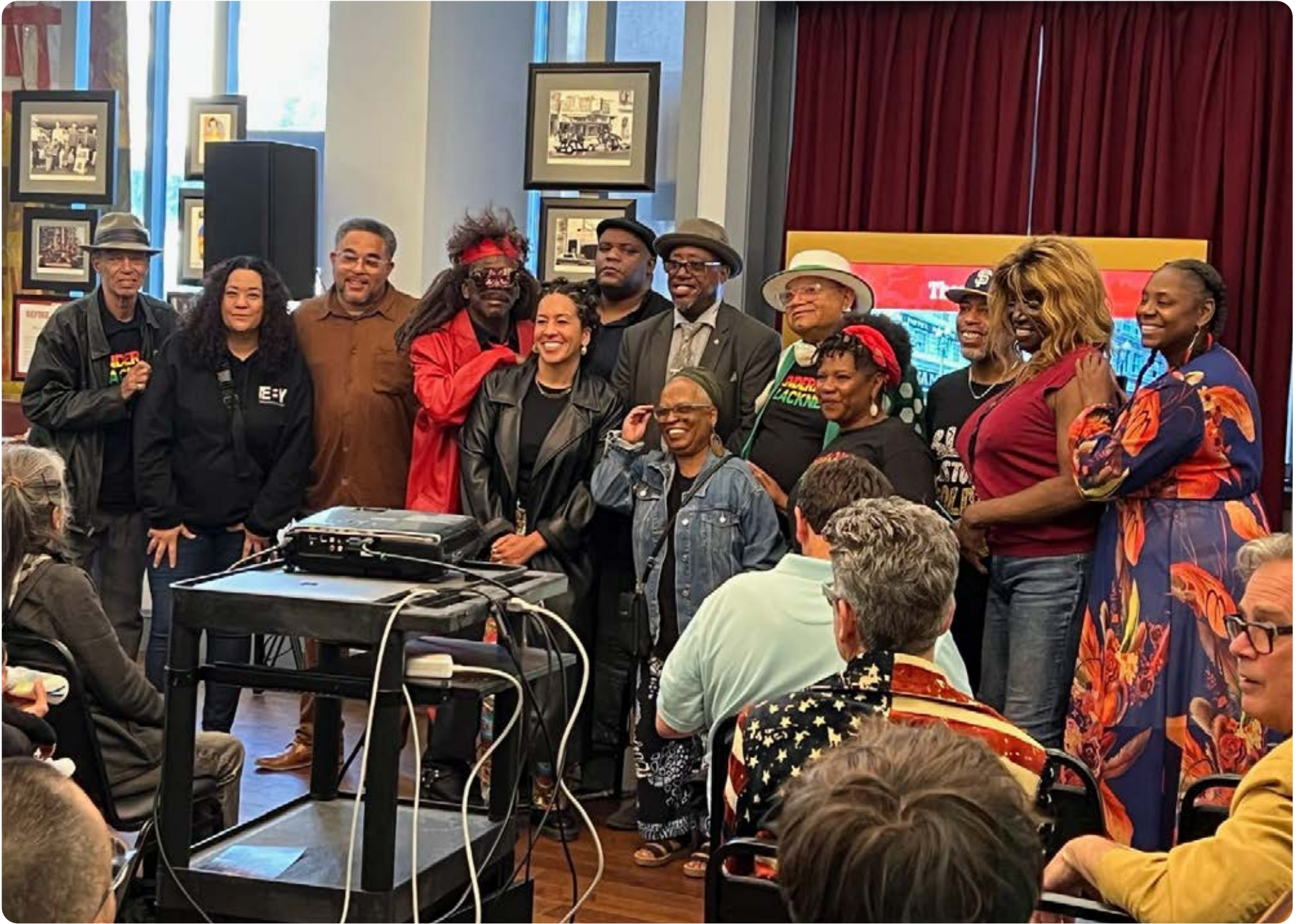
TL Blackness Exhibition Speaker Panel at Tenderloin Museum

TL Blackness colaborará con el Museo Internacional de Arte de América (1023 Market Street) para trasladar la exposición a la recién nombrada Tendergold Gallery, el domingo 6 de octubre de 2024, de 2 a 4:30 P. M. En el evento se celebrará el cambio de nombre que honra la historia y las experiencias en Tenderloin. ¡La entrada es gratuita y habrá comidas y bebidas!