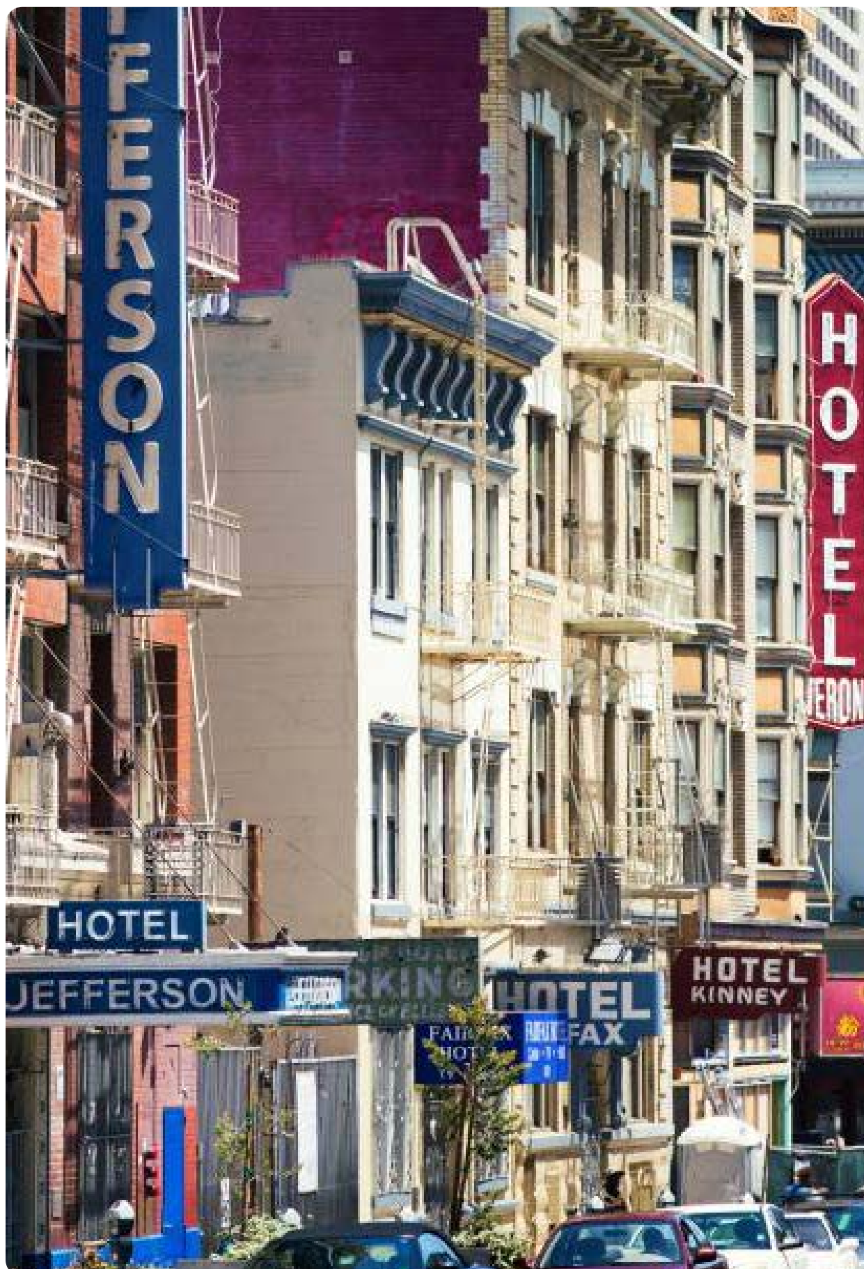
Eddy Street SRO's