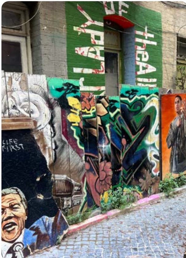
Bức tranh tường tại Tenderloin National Forest