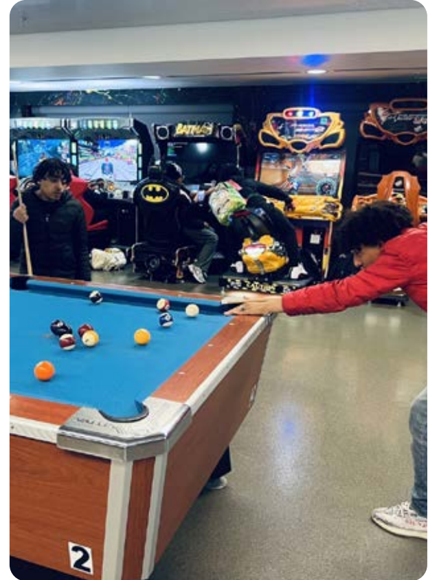
Sự kiện Ra mắt Trung tâm dành cho Thanh thiếu niên

“Tôi muốn đến đây mỗi ngày vì nơi này giống như nhà của tôi vậy. Có rất nhiều hoạt động để tôi lựa chọn. Tôi vừa trở về từ khu trò chơi điện tử và bây giờ tôi đang đến khu chơi bóng rổ.” – Thanh Thiếu niên tham gia