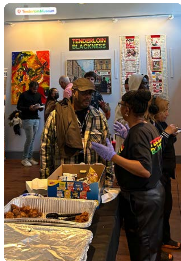
Lễ khai mạc Triển lãm TL Blackness

TL Blackness sẽ hợp tác với Bảo tàng Nghệ thuật Quốc tế của Mỹ (1023 Market Street) để tổ