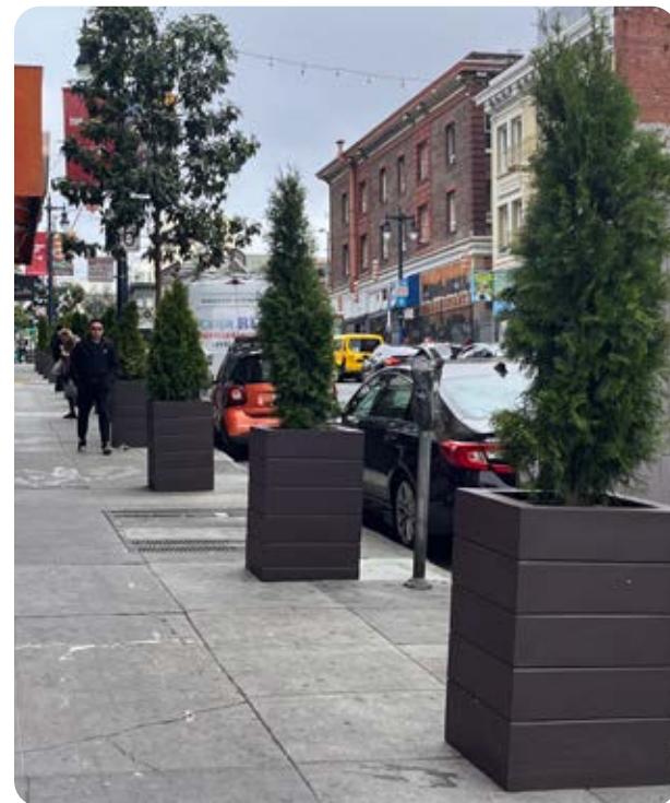
Tiến hành bố trí các chậu cây ở Little Saigon đang được tiến hành