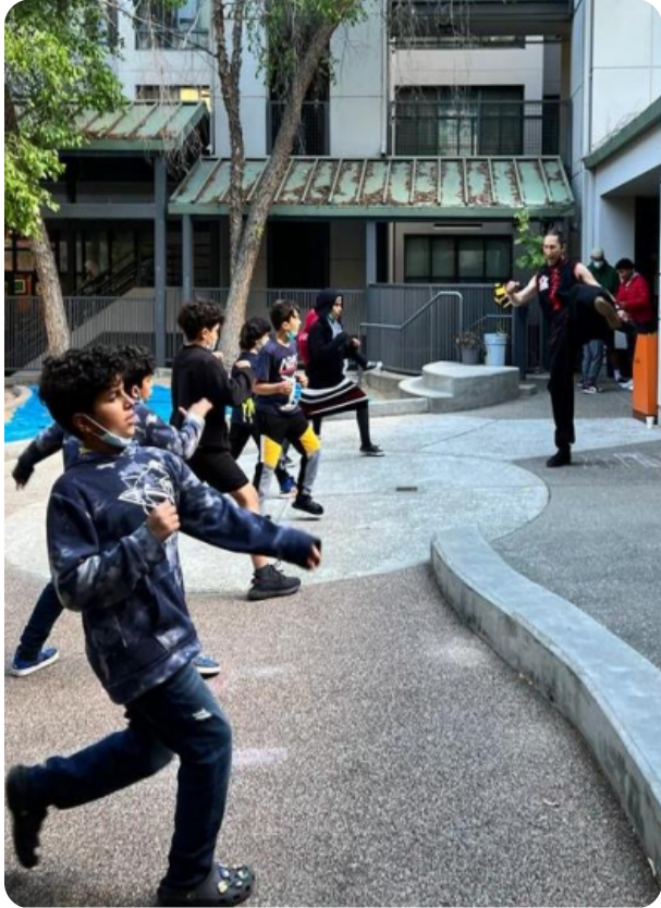
Youth gather for a group activity at the Tenderloin Children's Playground.

2024年4月, DCYF發佈了2024年至2029年預算週期的提案邀請書 (Request for Proposal, RFP), 其中涉及一筆新的撥款 (金額超$4.6億), 這筆撥款將用於支持舊金山的兒童、青年及他們的家庭。然而, 由於目前預算處於赤字的情況, DCYF不得不削減約$5200萬的RFP資金。