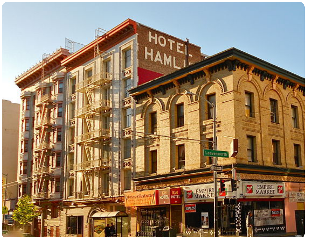
Hamlin Hotel (385 Eddy Street) has 67 SRO units and is currently owned by the Chinatown Community Development Center (CCDC).

TCAP將與社區組織和市政機構合作, 努力增進對住房修繕需求的了解, 並倡導增加籌資機會和完善相關政策。