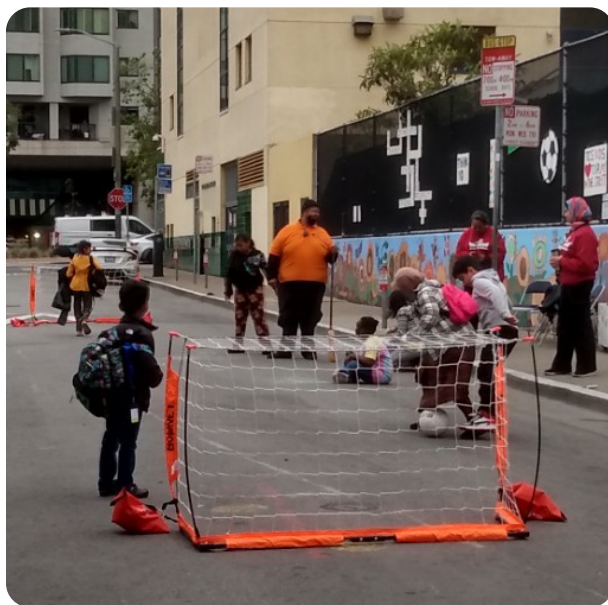
Children playing soccer on Elm before school begins.