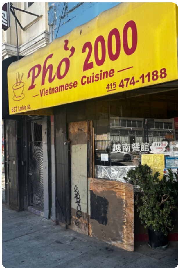
Pho 2000 at 637 Larkin Street.

利用這筆資金, Tenderloin首次以越南語和中文普通話提供業務培訓, 為不會說英語的企業主提供服務。