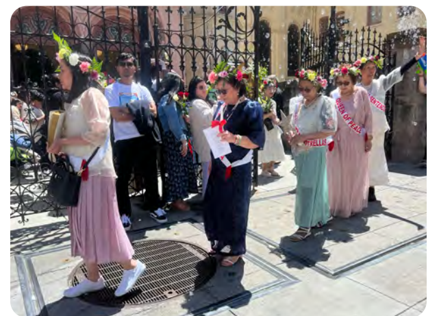
五月花節 - May 26, 2024