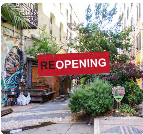
Tenderloin National Forest at 509 Ellis Street.