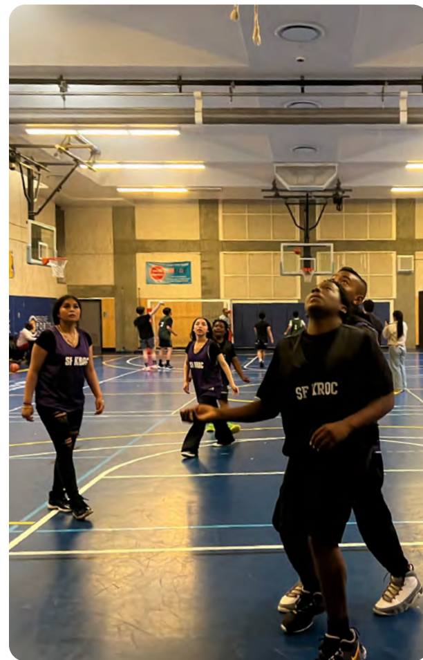
3v3 Tenderloin Basketball Tournament at Kroc Center.