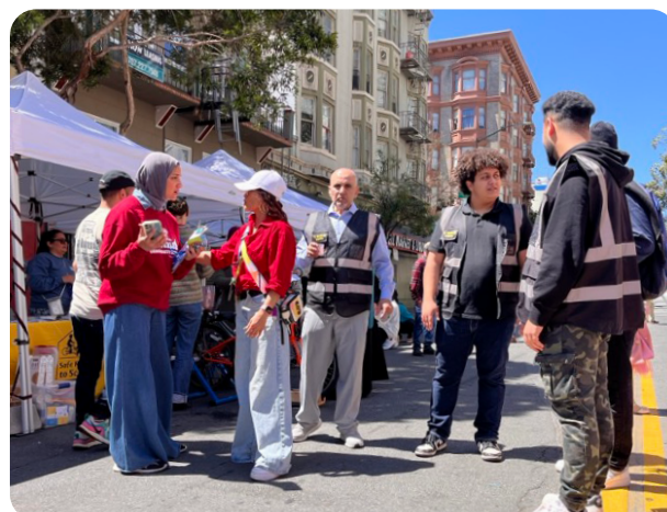
開齋節慶祝活動 - April 20, 2024