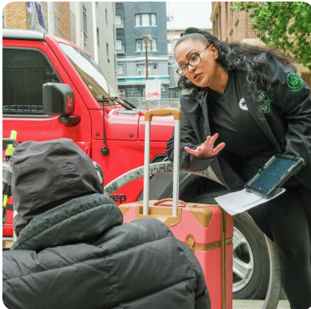
Department of Emergency Management (DEM) and Urban Alchemy's Homeless Engagement Assistance Response Team (HEART) field operations in action.

市政府在全市範圍內開展了各種街道外展和響應工作，其中部分工作主要針對Tenderloin地區。