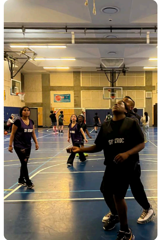
Torneo de Baloncesto 3v3 del Tenderloin en el Kroc Center.