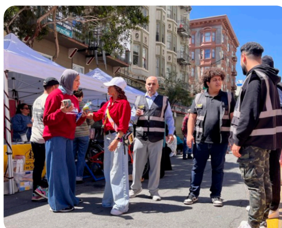
Celebración del Eid - 20 de abril de 2024 ▲