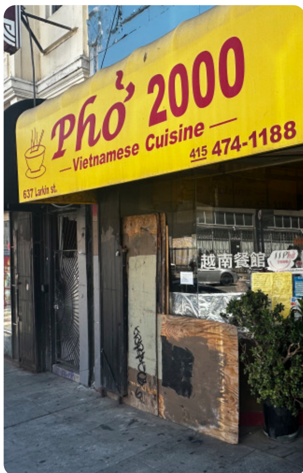
Pho 2000 en 637 Larkin Street.

Por primera vez en Tenderloin, se impartirán cursos de formación empresarial en vietnamita y chino mandarín gracias a esta subvención destinada a propietarios de negocios que no hablan inglés.