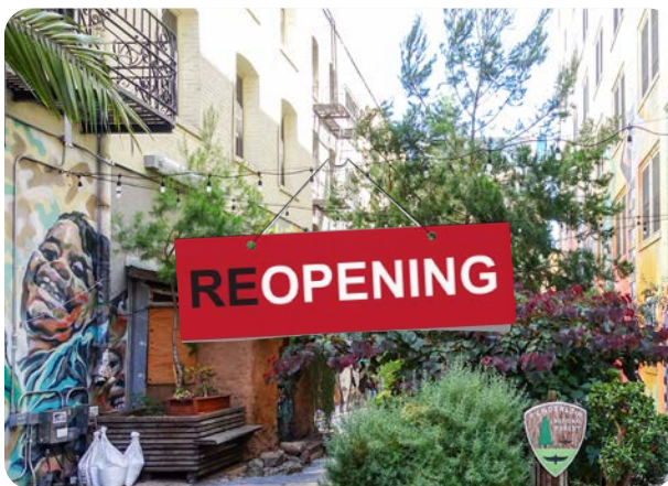
Tenderloin National Forest en 509 Ellis Street.