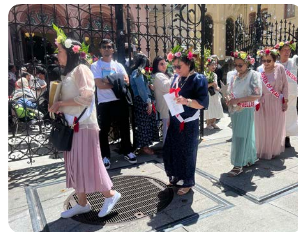
▼ Festival Flores de Mayo - 26 de mayo de 2024