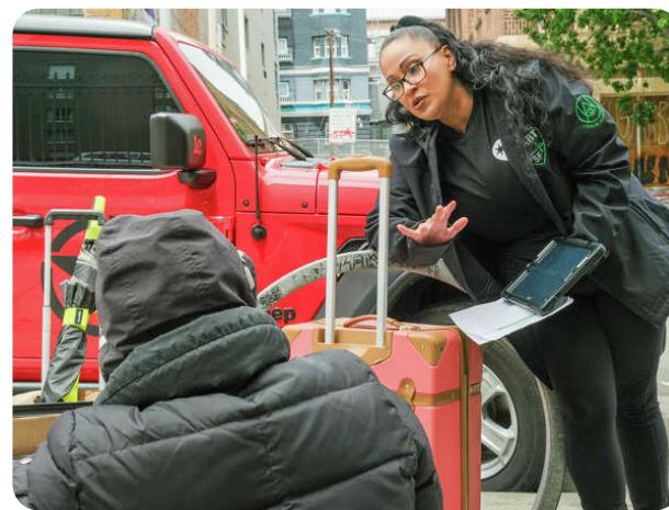
Operaciones de campo en acción del Departamento de Manejo de Emergencias (DEM) y del Equipo de Respuesta de Asistencia y Compromiso con Personas sin Hogar (HEART) de Urban Alchemy.

La Ciudad proporciona varios esfuerzos de divulgación y respuesta para las calles en toda la Ciudad, con algunos esfuerzos específicos para Tenderloin.