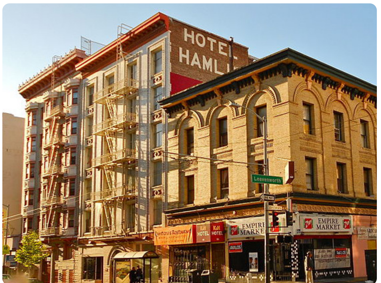
El Hotel Hamlin (385 Eddy Street) tiene 67 unidades SRO y actualmente es propiedad del Centro de Desarrollo Comunitario de Chinatown (CCDC).

En asociación con organizaciones comunitarias y agencias de la ciudad, el TCAP se embarcará en un esfuerzo para entender mejor las necesidades de rehabilitación y abogar por mayores oportunidades de financiamiento y mejores políticas.